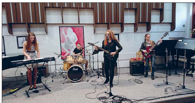
DÍVČÍ ansámbl AiKen ze ZUŠ E. Marhuly.