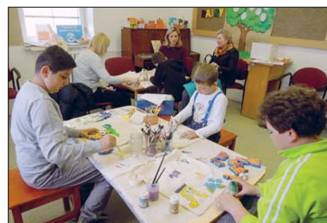
V KMO, pobočce Daliborova, děti vyráběly dárky pro maminky – malované tašky. Tuto akci finančně podpořil Nadační fond Albert v rámci grantového programu s názvem Bertík pomáhá 2017.

Pondělí 10. července od 13.30 do 16.30 hodin Ve výtvarné dílně budeme tvořit z keramické modelovací hmoty, součástí dílny bude čtení pověstí. Projekt je realizován za finanční podpory Nadace Landek.