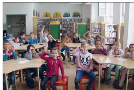
ŽÁKŮM ze ZŠ Gen. Janka byl po návštěvě Knihovny města Ostravy, pobočky J. Trnky, předán symbolický klíč od světa knih.

Projekt Fáráme do knihovny Landecká venuše